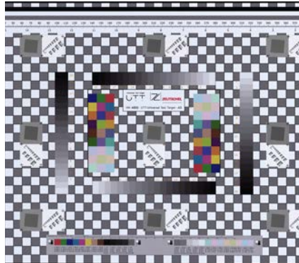
Erfüllt die Standards ISO 19264-1 Level A, Metamorfoze Full und FADGI 4 Star