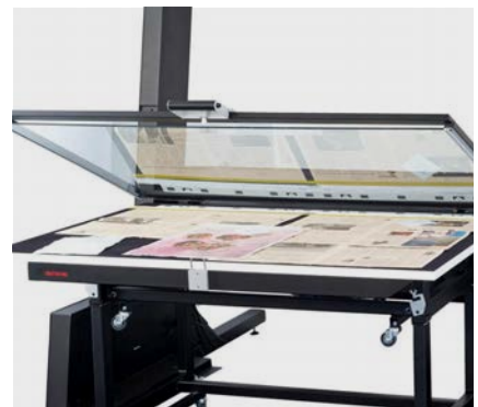
Auflichttisch AT 0 mit geöffneter Glasplatte