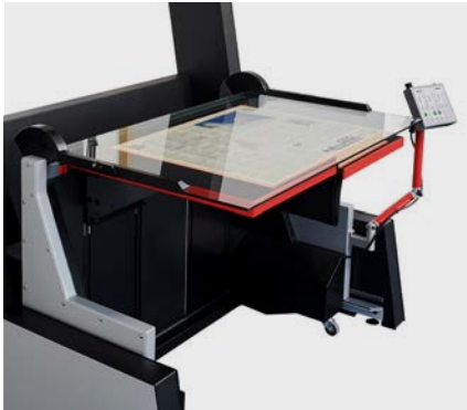
Umfangreiches Sortiment an wechselbaren Aufnahmesystemen