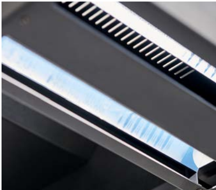
LED-Beleuchtungssystem für reflex- und schattenfreie Ergebnisse