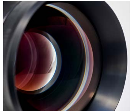
Perfektes Zusammenspiel hochwertiger technischer Komponenten