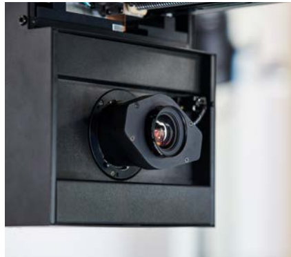
Kamerasystem auf Basis eines CMOS-Sensors