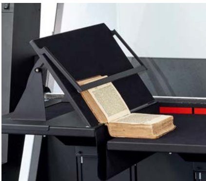
Buchstütze auf Buchwippe OT 180 H 35 XL