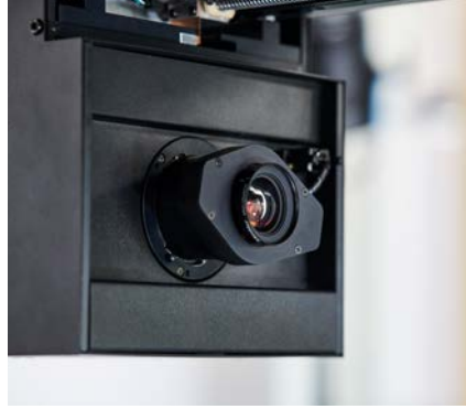
Kamerasystem auf Basis eines CMOS-Sensors